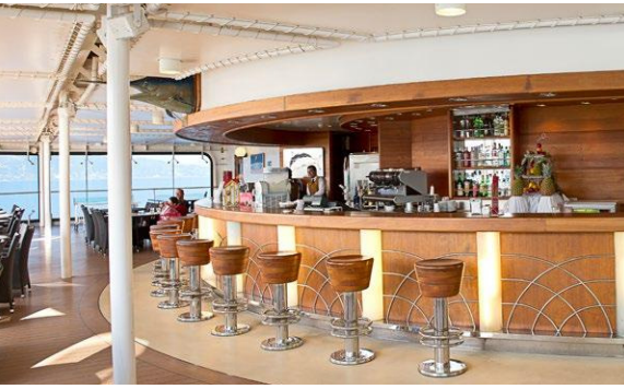
BLUE MARLIN BAR