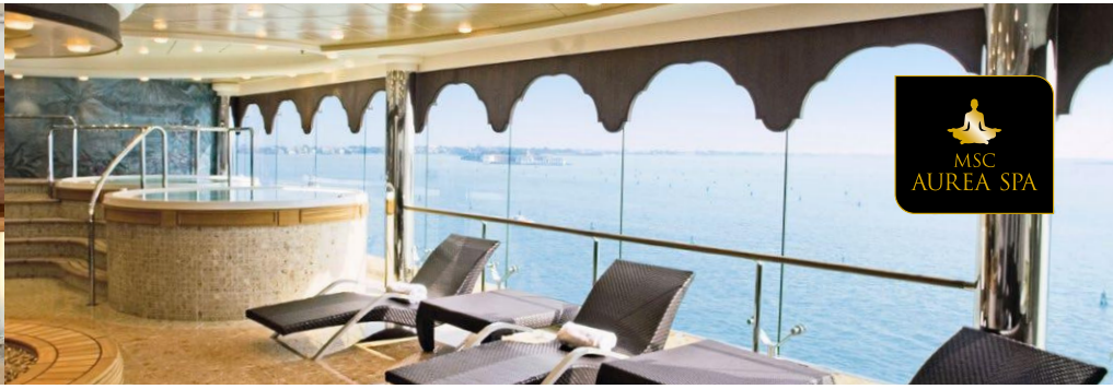
MSC AUREA SPA