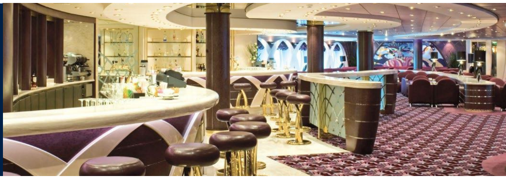
IL TUCANO LOUNGE